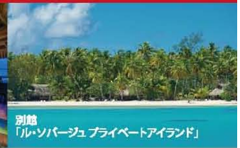
別館「ル・ソバージュプライベートアイランド」