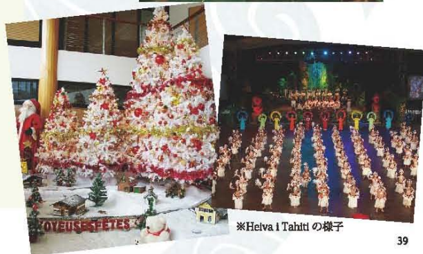
※Heiva i Tahitiの様子