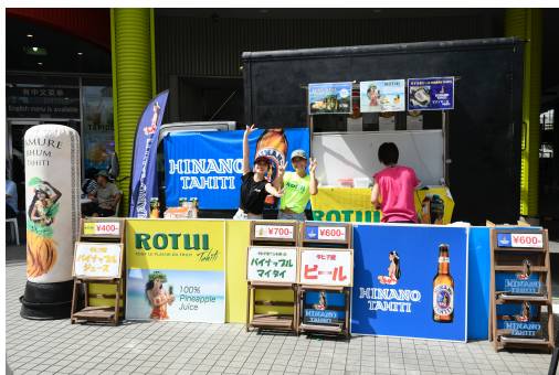
タヒチアンドリンク