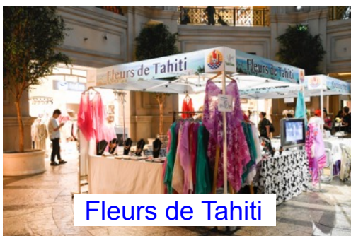
Fleurs de Tahiti