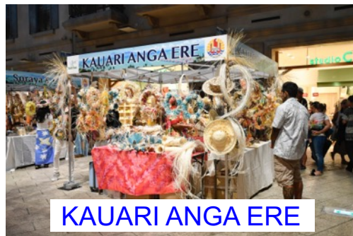
KAUARI ANGA ERE