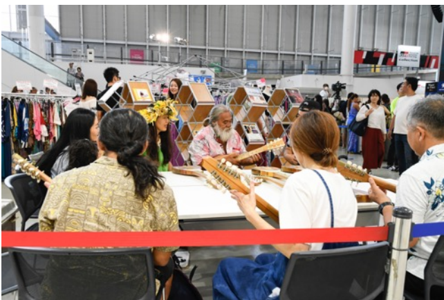
ウクレレワークショップ