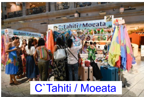
C`Tahiti / Moeata