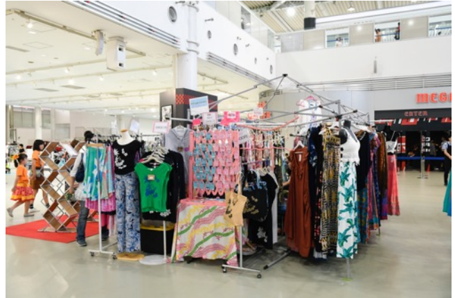
アンティークラバーズ