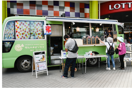
マルハチピッツァ