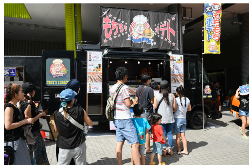
リングスキッチン